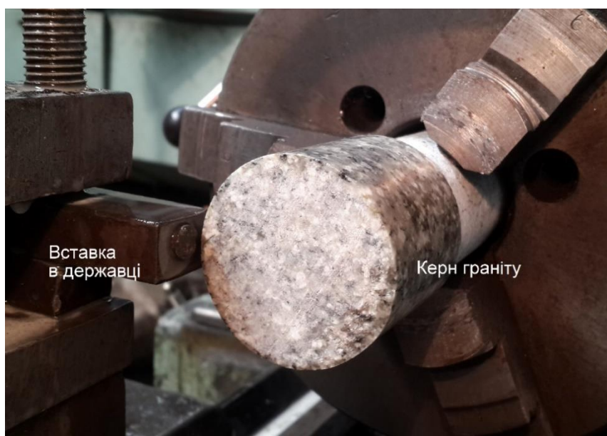
Рис. 1. Зовнішній вигляд стенду для дослідження зносостійкості породоруйнівних вставок

Дослідження зносостійкості вставок проводили за схемою «циліндр–вал» шляхом точіння ними циліндричного керна коростишівського граніту ІХ категорії буримості з використанням випробувального стенду на базі токарно-гвинторізного верстата ІА616 (рис. 1).