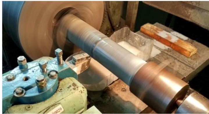
Рис. 1. Випробування на інтенсивність зношування на токарно-гвинторізному верстаті ФТ - 11

Кінетику зношування пластин АТП під час різання в режимі реального часу також вивчали з урахуванням зміни складових сили різання, які вимірювали універсальним динамометром УДМ-1200. Отримані дані фіксували в апаратно-програмному комплексі з модулем вимірювання з АЦП та опрацьовували на ПК. На випробуваннях використовувалося спеціальне пристосування для закріплення керна гірської породи у вигляді розрізного циліндра і склянки, а також спеціальний різець для закріплення зразка досліджуваного АТП.