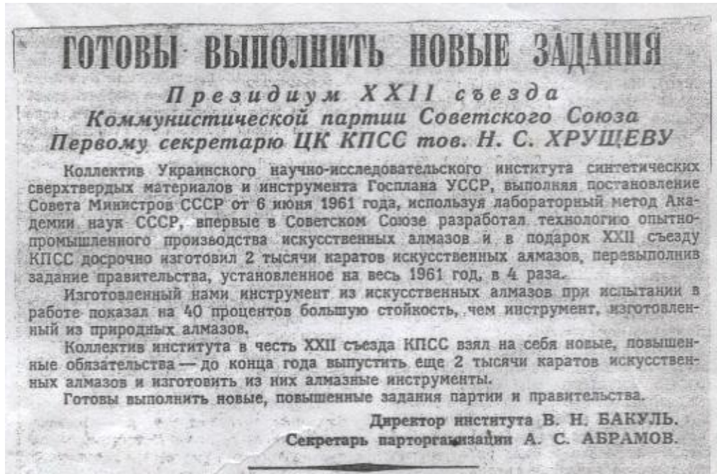
Рапорт колективу інституту про виготовлення перших 2 тис карат алмазу, опублікований в газеті «Правда» 21 жовтня 1961 року

Після всього цього почалося паломництво керівників усіх рангів України та СРСР подивитися синтез алмазів.