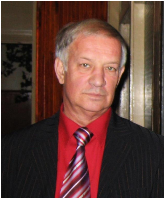
Житнецький В.І. (1941–2024)

Інститут надтвердих матеріалів було створено в Києві у 1961 році на базі Центрального технологічного бюро тврдосплавного інструменту та його дослідного заводу з метою розробки промислового синтезу алмазів та інших надтвердих матеріалів і прогресивних інструментів на їх основі. В основу промислового синтезу алмазів в інституті була покладена теорія фізико-хімії синтезу алмазів, розроблена О.І. Лейпунським у 1939 р. Значний внесок у створення та вдосконалення апаратури високого тиску, що забезпечила можливість проведення наукових досліджень і технологічних робіт у кілобарних діапазонах тисків, зробив академік Л.Ф. Верещагін, під керівництвом якого вперше в СРСР у 1960 р. в лабораторії Інституту фізики високих тисків був здійснений синтез алмазу з графіту. Засновником і першим директором Інституту надтвердих матеріалів у Києві став доктор технічних наук, Герой Соціалістичної Праці Валентин Миколайович Бакуль, ім'я якого присвоєно інституту у 1990 р.